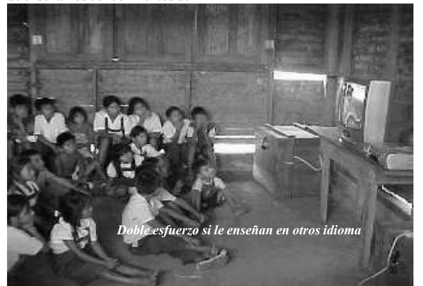
Doble esfuerzo si le enseñan en otros idioma

Para lograr que las escuelas, los colegios y las universidades enseñen a nuestros hijos utilizando la educación intercultural bilingüe, tenemos que exigir que así sea. No va a cambiar la educación por arte de magia. Tenemos que organizarnos como pueblo para exigir que los profesores sepan hablar nuestro idioma, exigir más participación en la escuela por parte de los padres de familia. Los papás o abuelos pueden ponerse de acuerdo con el maestro o la maestra e ir a la escuela y dar clases de medicina natural, del arte de tejer, de tintes naturales, de música y danzas. Los alumnos pueden visitar la chacra de algunos papás y ayudarles a sembrar o cosechar, así aprendiendo también. Los curanderos, autoridades políticas y espirituales deben compartir sus saberes con los alumnos. Tenemos que exigir a nuestras autoridades fuera y dentro de las comunidades que cambie la educación. Tenemos que exigir y conversar con los maestros y maestras, y sobre todo, tenemos que contribuir nosotros mismos y aportar a la escuela como madres y padres y ayllu compartiendo lo que sabemos.