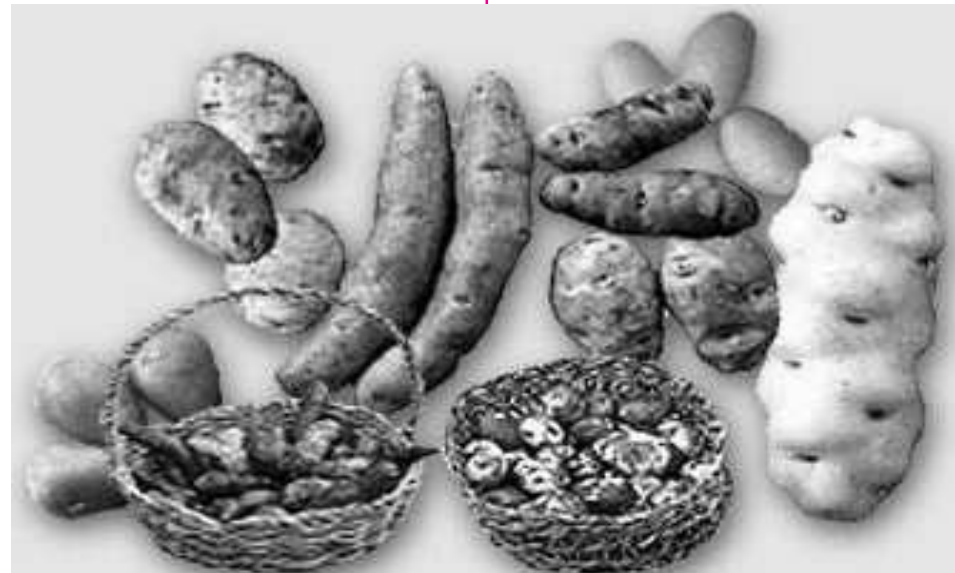
La papa: el gran aporte a la alimentación mundial de los pueblos originarios andinos

Es gratificante que la revista digital peruana Boletín de New York difunda el valioso patrimonio de la milenaria sociedad Andina y que es, también, patrimonio de la humanidad. Una de las formas para conservarlo, es justamente que se conozca a través de un medio como esta revista digital, permitiendo a sus lectores informarse correctamente sobre la importancia que significa observar y proteger el legado de nuestros ancestros. Entre lo mucho que nos queda por hacer juntos, envío desde Los Andes un fraternal saludo a sus lectores y agradecer a su editor Luis A. Ramírez por divulgar las virtudes y conocimientos desarrollados por la civilización Andina.