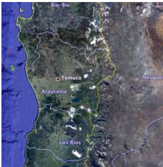
Imagen 1: Temuco, Región de la Araucanía. 2

En la Araucanía, como en muchas otras regiones del mundo, el hip-hop extiende tradiciones de expresión y resistencia que preceden la cultura hip-hop en sí, lo que es un fenómeno global basado en el Bronx en los años 1970. El verso poético, ambos mapuche y hispánico, ha ayudado a definir las identidades culturales, y las actitudes sociales y políticas durante cientos de años de historia regional. Para los mapuche, su