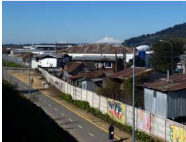
Imagen 3: Una pobla en Temuco

Las poblas (poblaciones) de Temuco y Padre las Casas suben y bajan entre colinas, abriendo abruptamente a las rurales comunidades mapuche, y los forestales, apenas afuera de los límites urbanos. La migración rural-urbano genera condiciones de pobreza urbana, entrelazadas con las costumbres de la vida rural.