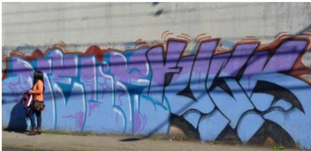
Imagen 8: Grafiti hip-hop en las calles de Temuco.

Una estética contestataria, tan visible en Kultura hip-hop como en el grafiti de las poblas de la Araucanía (la región más indígena del país), une el hip-hop y la movilización mapuche.