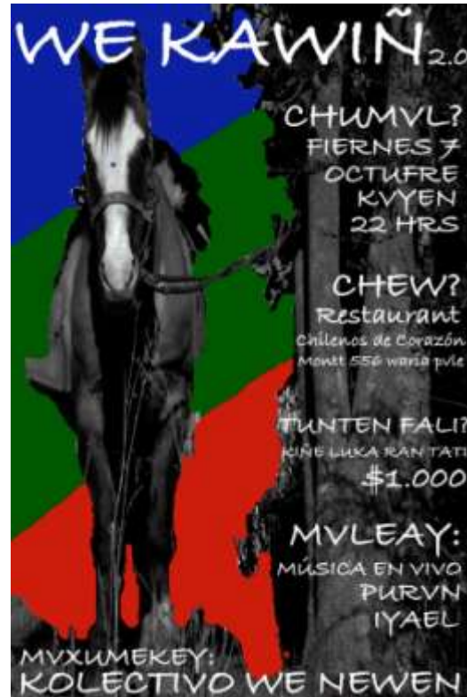
Imagen 5: afiche de peña “We Kawiñ” (Kolectivo We Newen).