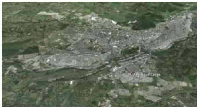
Imagen 2: La ciudad de Temuco y Padre las Casas (Google Earth)

El historiador Jorge Pinto (1988, 2003, 2009) se refiere a la Araucanía, ubicada en el noroeste del WallMapu, como una zona fronteriza desde hace varios siglos, caracterizada por el contacto entre los mapuche y otras civilizaciones. Según